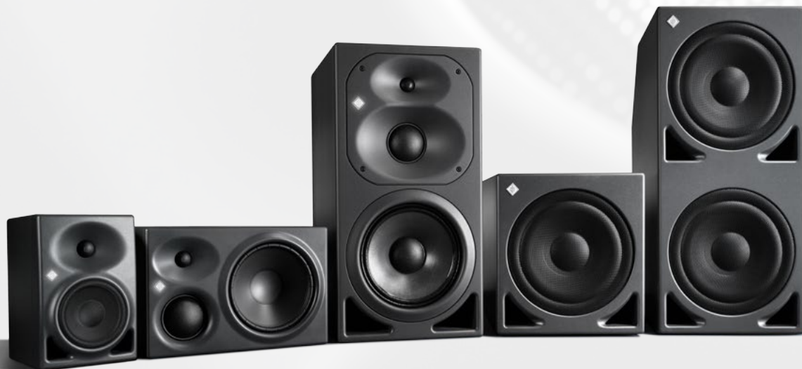
KH 120 A/D

You expect the best. So we give you our best.