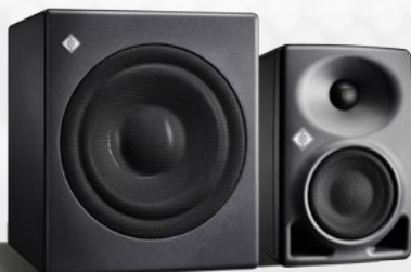
KH 750 DSP

Sie erwarten das Beste. Deshalb geben wir unser Bestes.