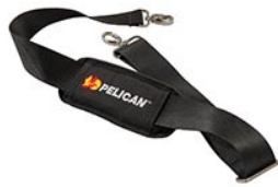
9487 Bandoulière rembourrée