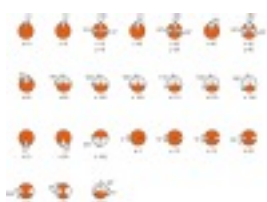
Position de fonctionnement